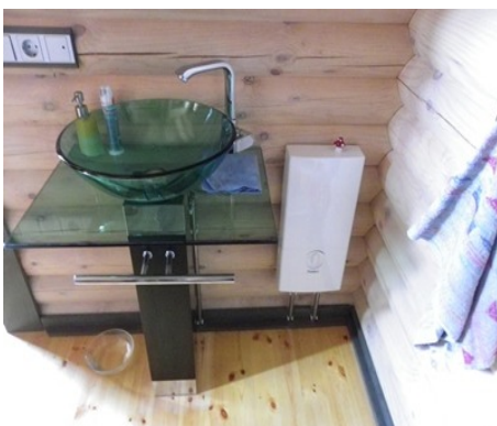
Waschbecken mit Durchlauferhitzer