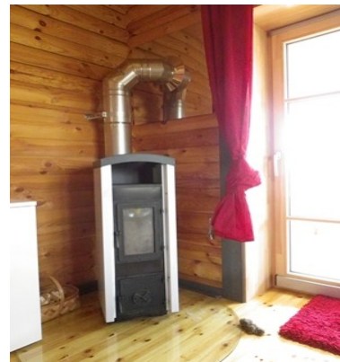
5kw Holzofen im Wohnzimmer