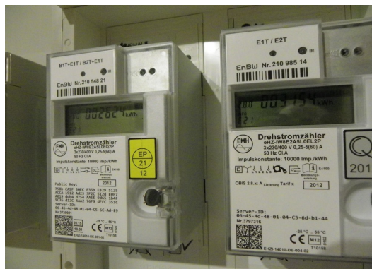
2654 kwh Stromverbrauch