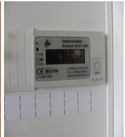
Zähler Infrarotheizung Zählerstand zum 07.03.2013 Verbrauch Winter 756kWh